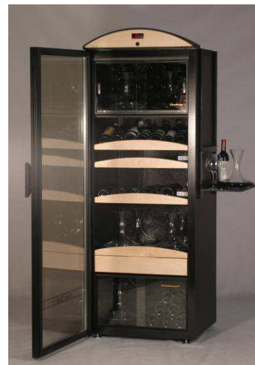
Précision, une cave conçue par Olivier Poussier, meilleur Sommelier du monde