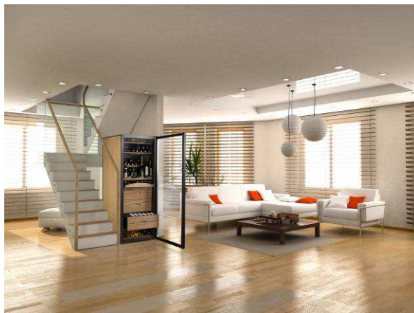
VSA710L en situation