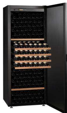
VSA710L, Château, noir

A chacun sa cave (de 100 à 300 bouteilles)