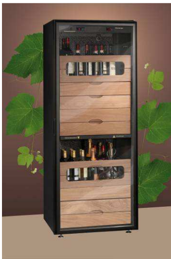
Vitiduo, une armoire de dégustation conçue par un viticulteur pour les professionnels du vin