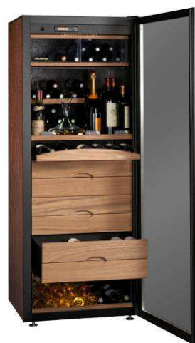
VSA730L 1 er Cru, wengé

Armoire à vin de vieillissement et de dégustation (chambrage et rafraîchissement)